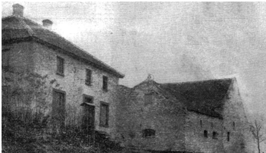
Het Oolderhuuske, schilderachtig aan de rivier tegenover het dorp gelegen. Zal de veerbel in de toekomst nog dienst doen?