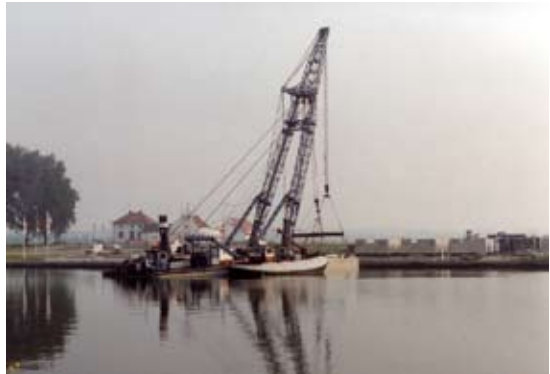
Gezicht op de haven waar de drijvende betonnen casco's worden afgebouwd.

Om bij hoge waterstanden in de Maas problemen te voorkomen, mag er van Rijkswaterstaat slechts een deel van het schiereiland bebouwd worden. Een gedeelte ligt namelijk in het zogenaamde waterbergend deel van de Maas. In dit gedeelte worden de 80 Marina's gerealiseerd. Marina's zijn drijvende woningen van vijf bij twaalf meter, die op een betonnen casco gebouwd worden. Ze stijgen en dalen naargelang de waterstand.