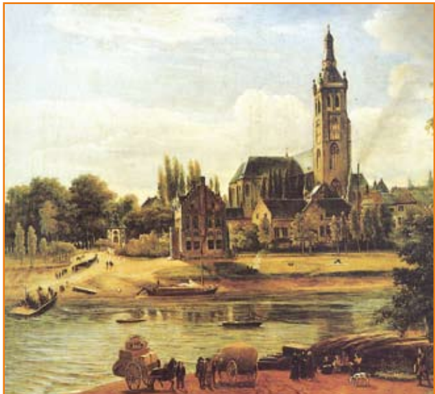
De Maasovergang in Roermond, geschilderd door J.A. van der Drift omstreeks 1850.

De reden waarom de Jezuïeten het plakkaat in hun archief bewaren, wordt door een korte notitie aan de onderkant van het plakkaat uit de doeken gedaan; 'de P. Jesuiten als besittersse der derthiende weecke'. De Jezuïeten hebben in Herten blijkbaar zoveel grond dat ze tot de geërfden worden gerekend, maar grootgrondbezitters zijn de Jezuïeten hier niet geweest. Pas aan het eind van de zeventiende eeuw verwerft de orde in Herten land.