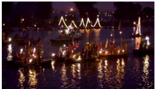
De gondelvaart, één van de hoogtepunten van het Nawaka in 1989.