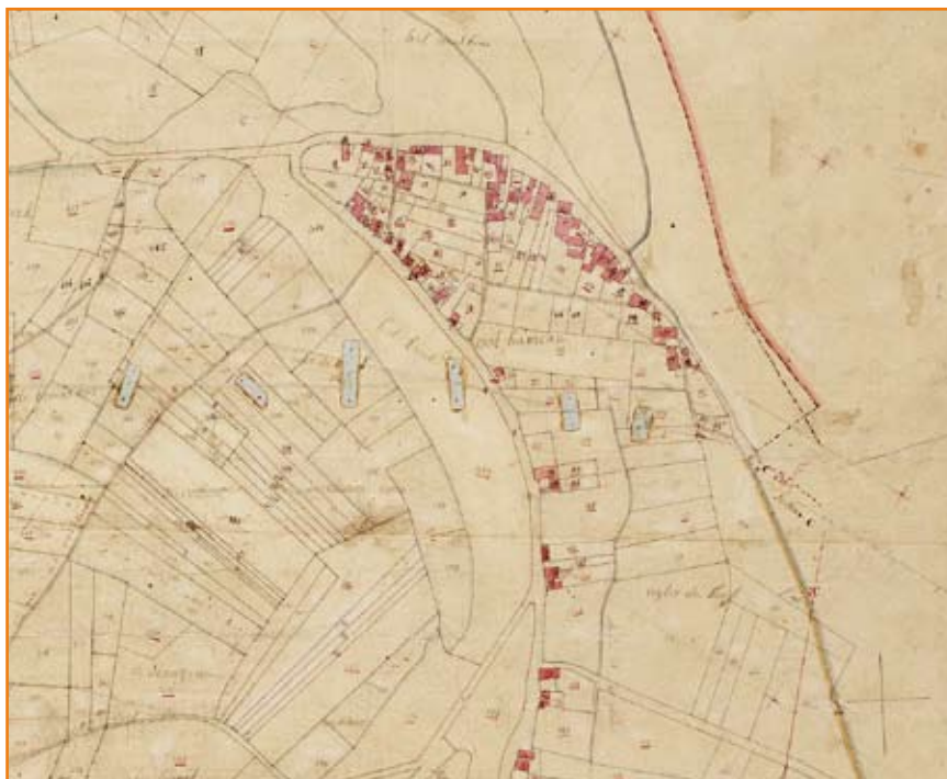
De kern Ool op een kaart van het kadaster omstreeks 1818.

Het vele lokale en interlokale verkeer dat vanuit Roermond richting Brabant reist, verlaat de ommuurde stad dan ook door de (dubbele) Brugpoort, steekt de Maria Theresiabrug over en volgt na de Voorstad Sint Jacob de Hertenerweg tot aan de Bonenbergh. Tot 1824 moest het verkeer nog per veer de Hambeek oversteken, daarna werd er een tolbrug gelegd. Van daar uit vervolgt men de weg langs de Maas naar Ool. Na de overtocht zetten de reizigers in het dorp Beegden weer voet aan vaste wal.