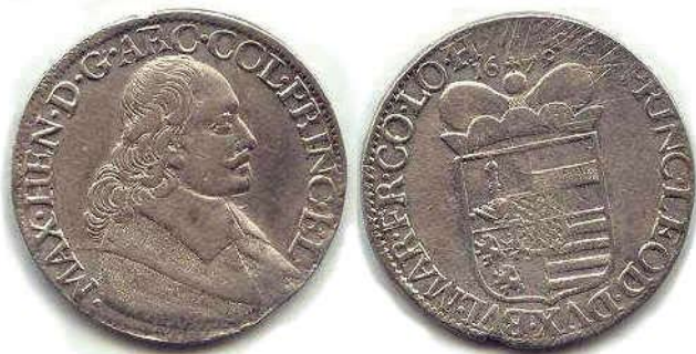
Luikse Patacon 1679

Lang hebben de paters hun nieuw verworven bezit niet gehad. In een akte van amortisatie van 29 maart 1756, die in Brussel door prins Karel van Lorreinen, landvoogd van de Oostenrijkse Nederlanden aan de Roermondse Jezuiten wordt verleend, worden de bezittingen in Herten niet meer genoemd. Meer grond dan het genoemde hebben de Jezuiten in Herten waarschijnlijk niet gehad. De duur van dit bezit was bovendien relatief kort, want in hun archief zijn er praktisch geen sporen meer van terug te vinden.