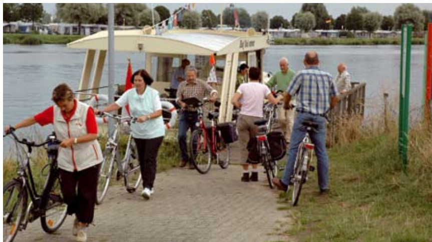
Het Oolder veer is nu een belangrijk knooppunt voor fietsroutes, fietsers en wandelaars.

“In Horn”, luidde het antwoord, “daar moet ik twee vette ossen gaan slachten”. De schaterlach der twee roofridders klonk tot over de Maas. Zij beloonden de veerman rijkelijk en schonken aan die van Ool ‘de greend’, aan de andere zijde van de rivier.