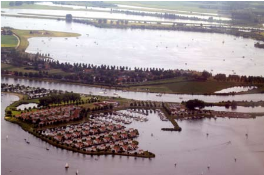
Resort Marina Oolderhuuske en Ool, met boven in beeld de Oolderplas, het vroegere Oolderveld.