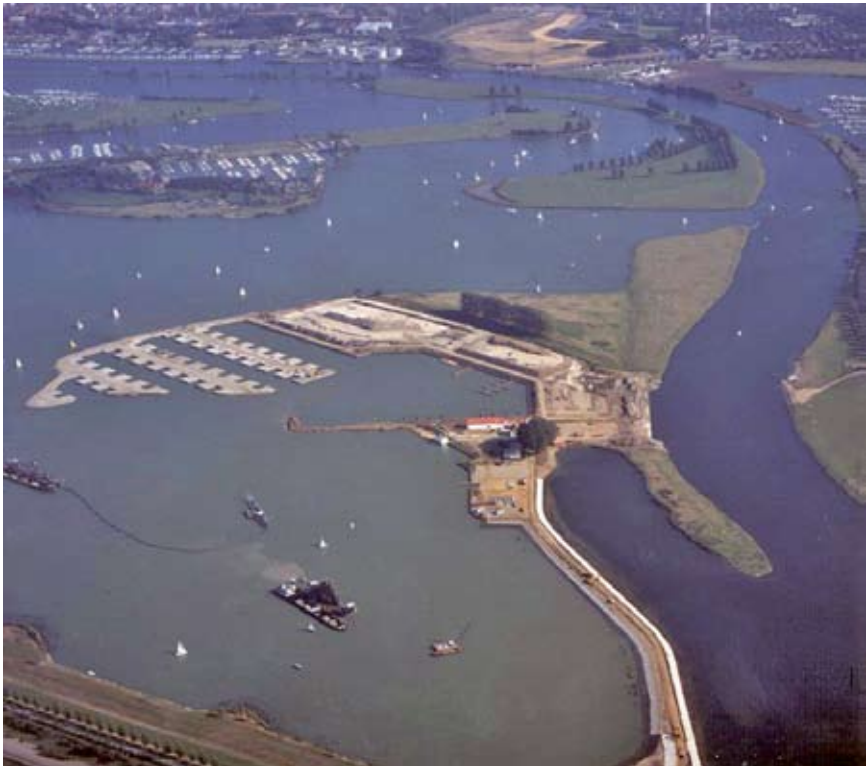
De werkzaamheden rond de aanleg van 'Marina Oolderhuuske' in vogelvlucht.

Door de ontgrindingen ontstaan in Midden-Limburg grote waterplassen, de Maasplassen. Deze zijn in oppervlakte groter dan de Vinkeveense- en Loosdrechtse plassen samen. In de jaren tachtig komt er veel belangstelling voor de herinrichting van de Maasplassen onder het motto: "Het gaat niet alléén om de ontgrinding, maar ook om het gebied dat erna ontstaat." In oktober 1988 komt de firma Smals met een plan voor het schiereiland, dat na de ontgrinding van de Ooldergriend is ontstaan. Op het schiereiland dat een oppervlakte heeft van ruim tien hectaren wil de onderneming binnen vijf jaar een jachthaven, een camping, vakantiehuisjes, een restaurant, tennisbanen en appartementen aan het water verwezenlijken.