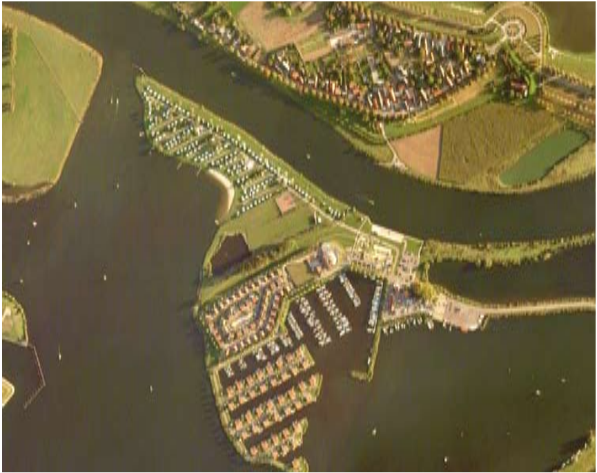
Resort Marina Oolderhuuske en Ool. (Google Earth 2006)