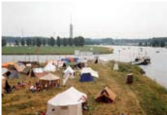
Opbouw van het kampterrein met uitzicht op een gedeelte van het huidige campingterrein.

De hoogtepunten van dit zomerkamp zijn de open dag, de vlootschouw en op de laatste dag de gondelvaart op de Maas met afsluitend vuurwerk. Duizenden kijkers uit Midden-Limburg aanschouwen dit feeëriek schouwspel langs de oevers van 'Mooder Maas'.